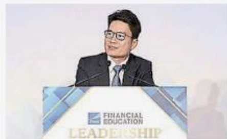
財經事務及庫務局副局長陳浩濂擔任主禮嘉賓，他於台上祝賀各獲獎機構，並感謝他們對社區理財教育的支持。

學會於2018年舉辦首屆「理財教育領袖大獎」，目的是嘉許企業及社會人士義務提供理財教育服務，藉此推廣財務策劃的重要性並提升香港市民整體金融知識水平。