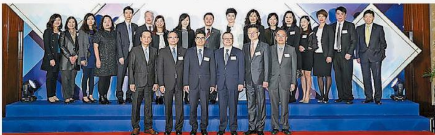
18名「企業理財教育領袖」、「企業理財教育領袖（積極推動大獎）」、「理財教育公民（企業團隊）」及「優質財策企業」的得獎代表與頒獎嘉賓大合照。

【香港商報訊】香港財務策劃師學會（學會）主辦，一年一度的《香港財務策劃師學會理財教育領袖大獎暨優質財策企業2020》頒獎典禮於上周四（15日）在香港麗酒店舉行，以表揚為提升本地市民金融知識而無私奉獻的傑出企業及社會人士。大獎今年踏入第3屆，是日的頒獎禮吸引了逾170名來賓出席，見證18間機構獲頒獎項，其中最高榮譽獎項——「年度最佳企業理財教育領袖」由「AXA安盛」、「南洋商業銀行」及「保誠保險有限公司」奪得。